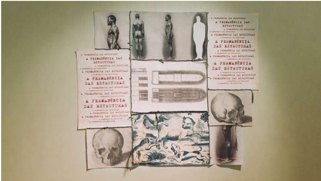
A Permanência das Estruturas (2017), de Rosana Paulino. Esta obra foi parte da exposição Atlântico Vermelho .